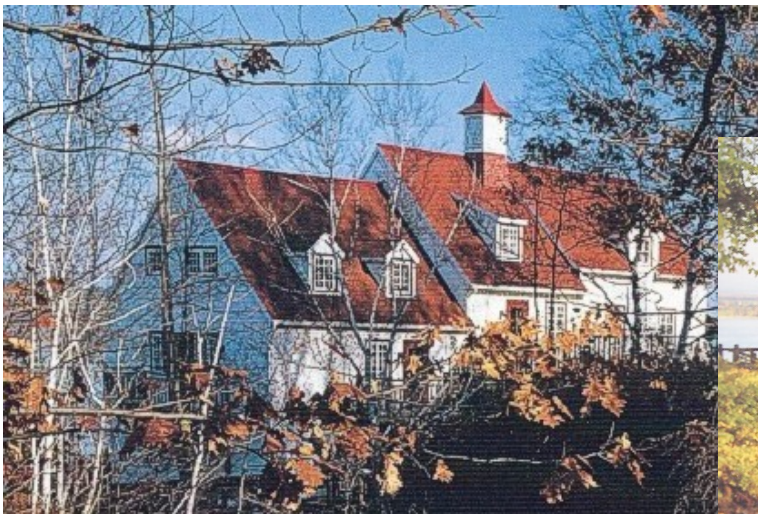
Moulin de Vincennes Beaumont