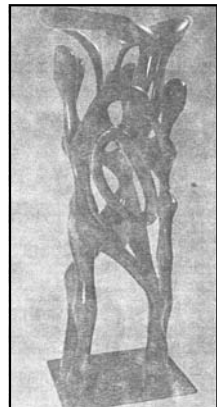
Farandole sculpture, de bois de pin 75 pouces de hauteur